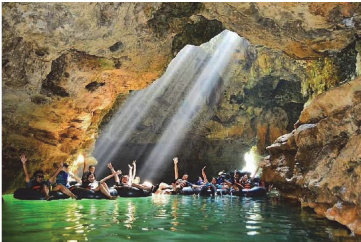
Photo n° 1 — Troisième salle de la grotte Pindul.

et du personnel administratif. Les groupes de femmes sont souvent affectés à la cuisine et à la réception. Les jeunes sont préférentiellement guides, photographes, ou s'occupent du parking. Les guides sont organisés selon un système de rotation permettant de répartir le travail entre tous et de s'accorder avec les activités agricoles. Ils sont donc payés par passage dans la grotte, les autres salaires étant indexés en fonction du nombre de touristes.