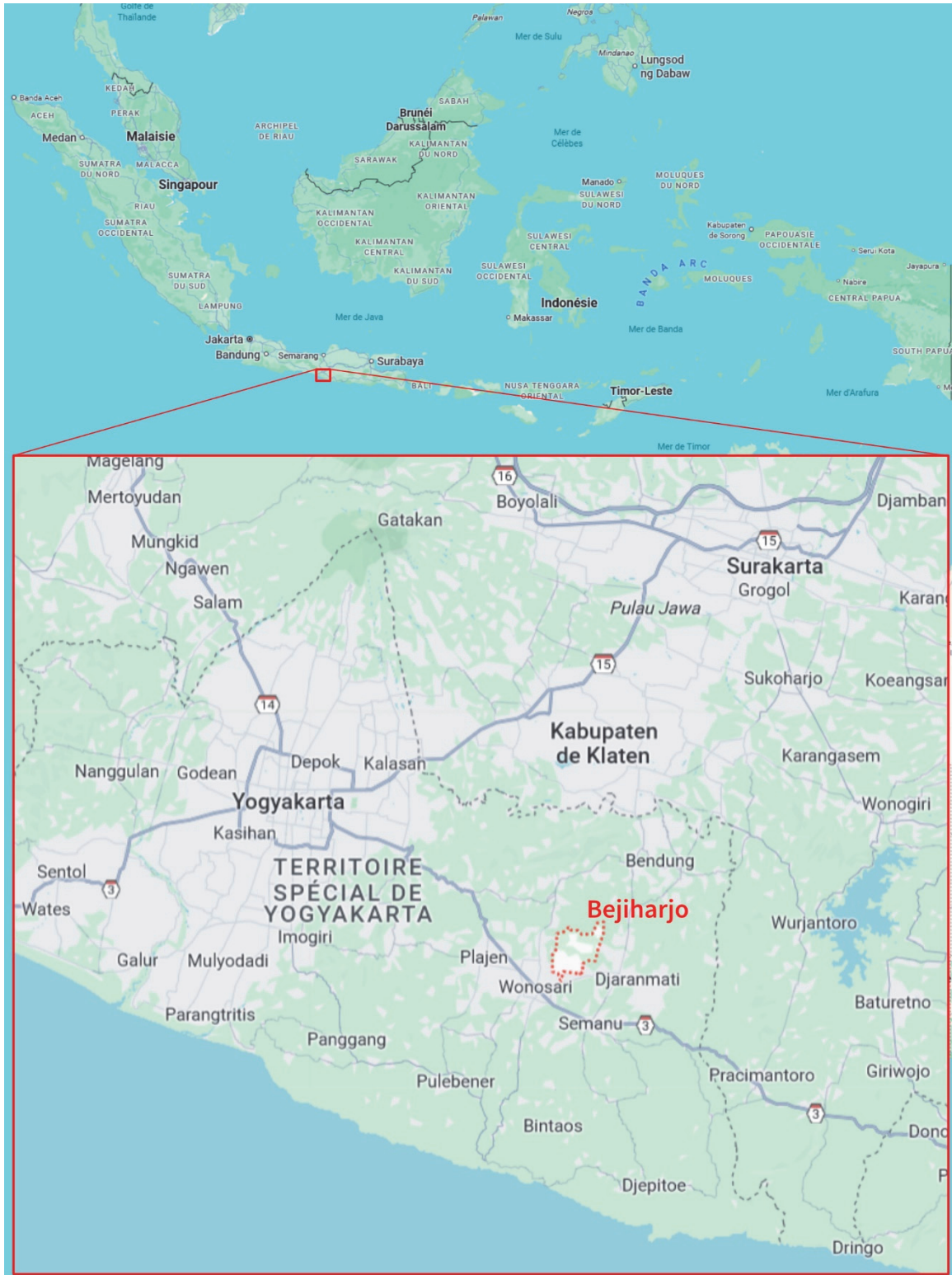
Carte n° 1 – Localisation village de Bejiharjo, Java, Indonésie.

Comme le notent Hery Sigit Cahyadi et David Newsome (2020 : 1), les géoparcs indonésiens font face à un surtourisme aux effets enchâssés :