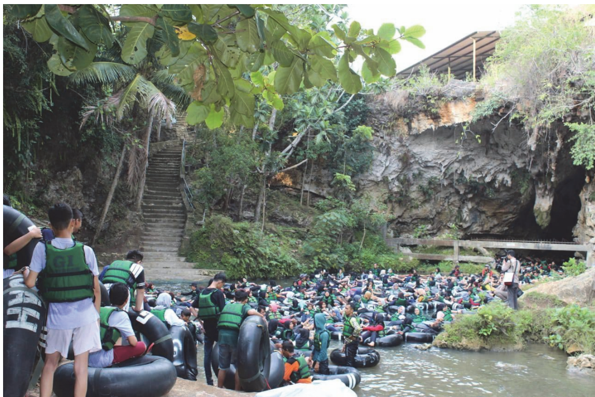
Photo n° 2 — Entrée de la grotte Pindul un samedi de mai 2019.

Si les créations successives d'opérateurs semblaient suivre le découpage de l'espace social des hameaux, les systèmes relationnels de proximité se sont progressivement recomposés autour de la nouvelle activité touristique. Les quatre premiers opérateurs s'appuyaient sur les territoires des hameaux autour de Pindul. Sans décrire ici l'entièreté des conflits fonciers et leurs évolutions, on note que les opérateurs touristiques suivants n'ont pas toujours pris comme assises l'organisation des jeunes du village et le rattachement à l'entité territoriale d'un hameau spécifique. Il peut y avoir plusieurs opérateurs touristiques dans un même hameau ou groupe de voisinage. C'est le cas par exemple dans les hameaux de Gelaran I, Gelaran II et Gunung Bang, qui comptent au minimum deux opérateurs touristiques chacun pour un ensemble d'environ 120 familles.