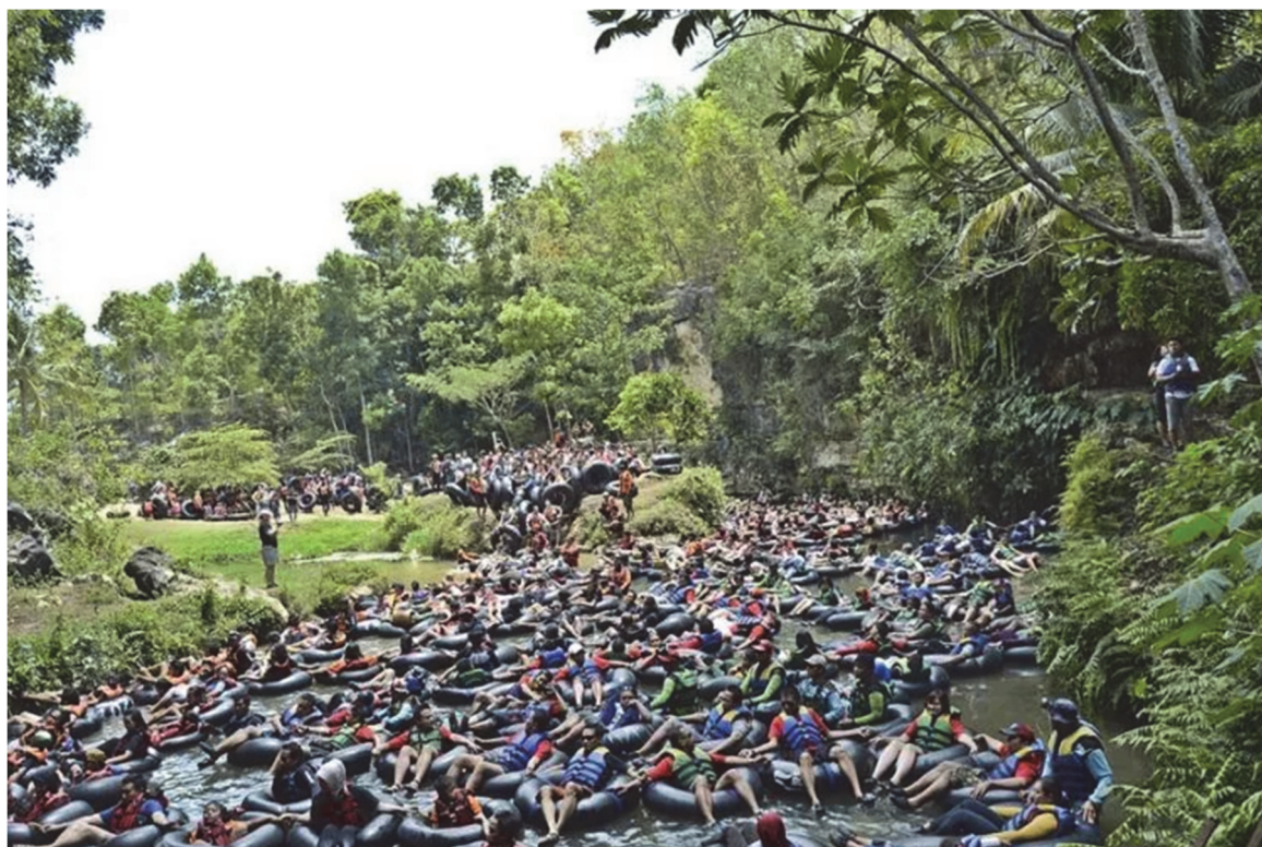
Photo n° 3 — Entrée de la grotte Pindul, lundi 4 novembre 2013 (image libre de droit, detik Travel).

et foncières se voient outrepassées. Les membres d'une même famille peuvent travailler dans des opérateurs différents, où le choix de travailler chez l'un ou l'autre opérateur va être motivé par la compétitivité de ce dernier (captation des touristes, salaires).